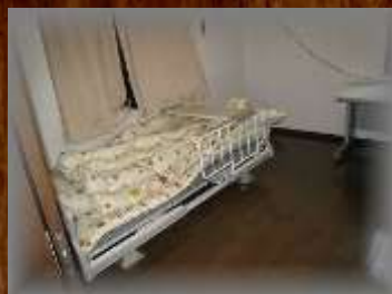
宿泊スペースの一例、個室対応