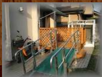
スロープのある玄関