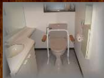
車椅子対応トイレ