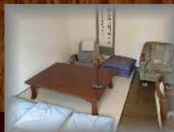
食堂の一角にある畳スペース