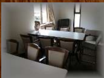
落ち着いた雰囲気の食堂